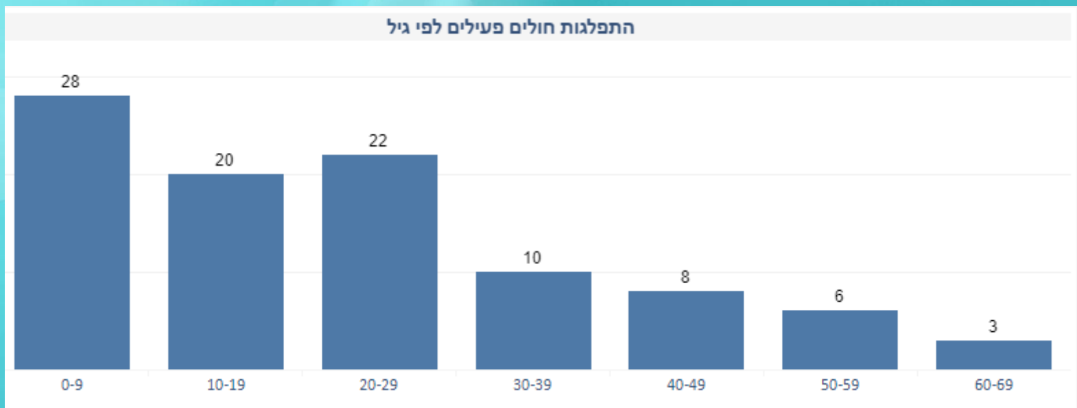
התפלגות חולים פעילים לפי גיל